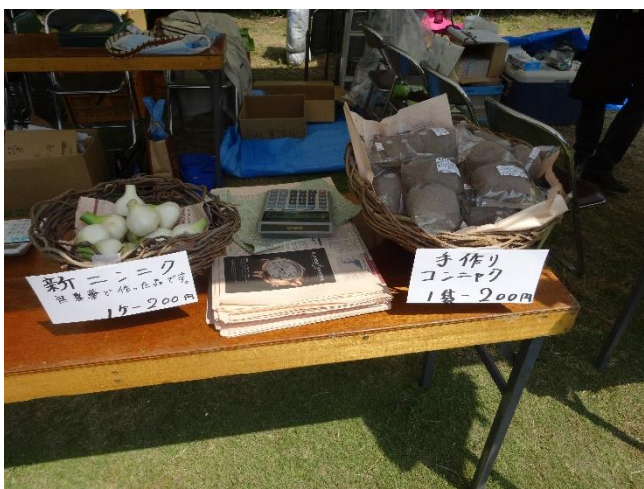
コンニャク、新ニンニク