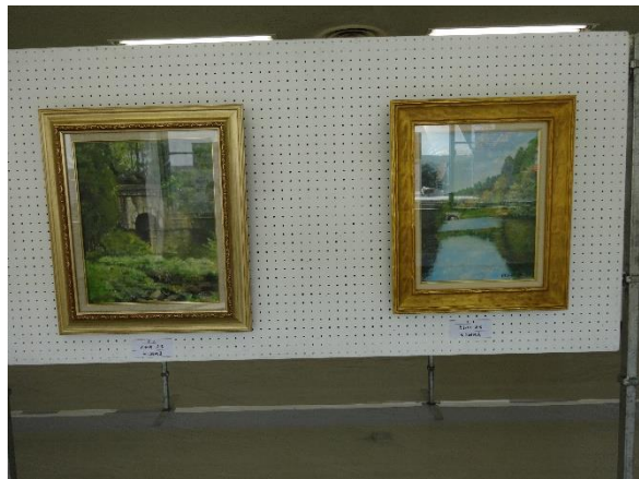
七つ洞公園の風景画が掲示されました。