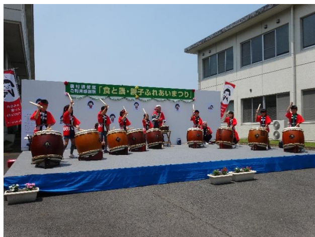
国田義務教育学校4年生の太鼓演奏です。