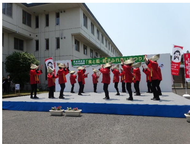
J A国田婦人部の「国田音頭」です。