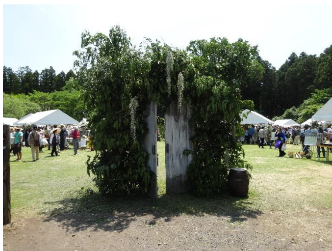
芝生広場への入り口