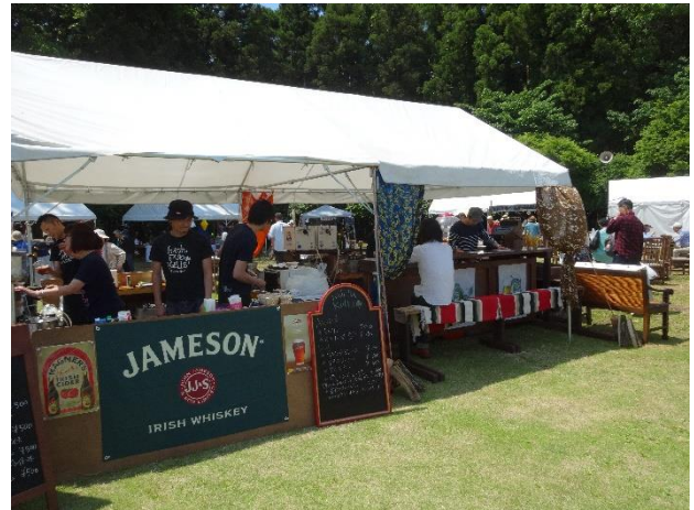
Kells • GAMBALL BAR