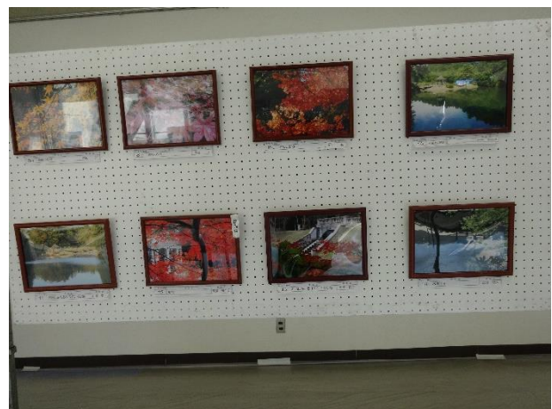
第1回七つ洞フォトコンテスト応募作品を研修室に展示しました。