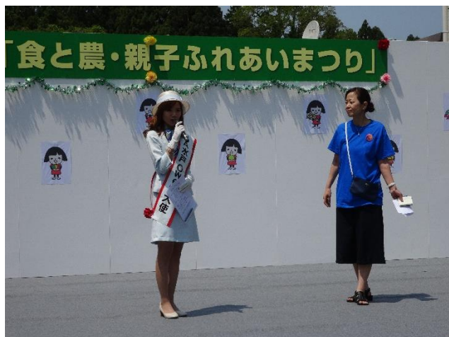
J A水戸OWEN大使のお嬢さんです。