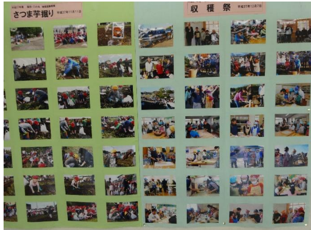
国田地区自治実践会の地域協働事業で国田と三の丸学校の農業に関する田植え、芋ほり、収穫祭等の写真を掲示しました。