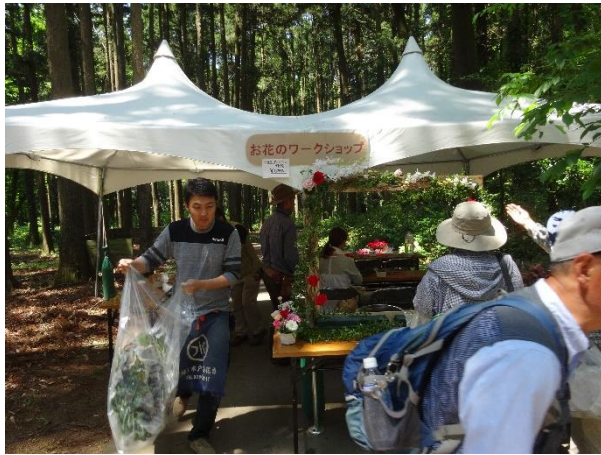
お花のワークショップ