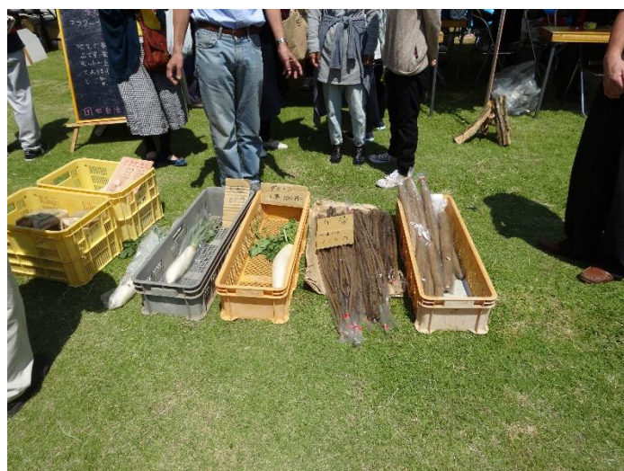
国田地区自治実践会・地元野菜販売コーナー