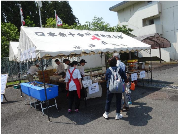
販売コーナーです。