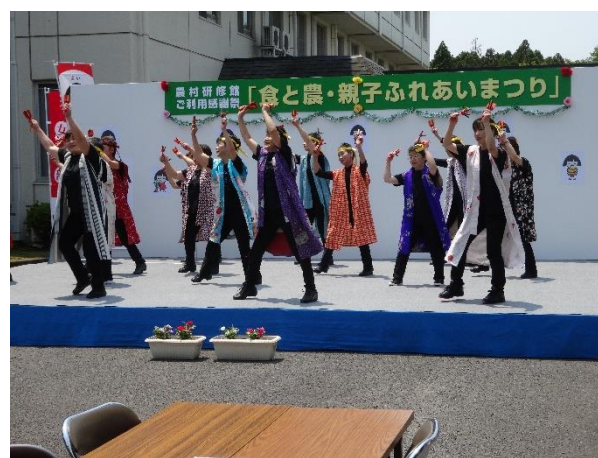
同じく婦人部の「よさこい」です。