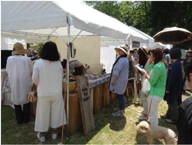
Sunny side Kitchen