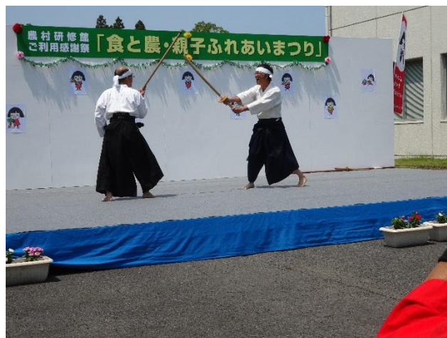
杖友会の田谷の棒術の演技が披露されました。