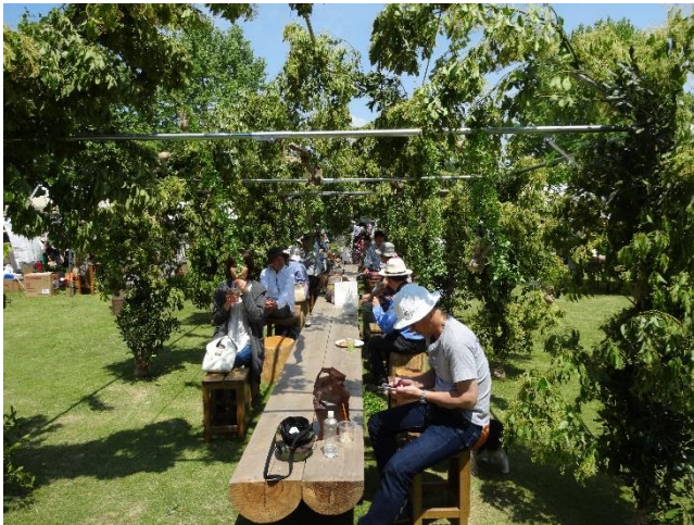
お休みどころ（センターテーブル）