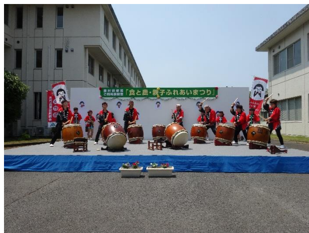
「国田太鼓」のメンバーによる演奏です。