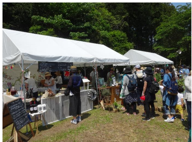
つくる。• FLOUR BASE105