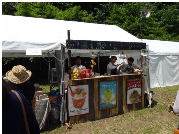
Doyle`s • Animato