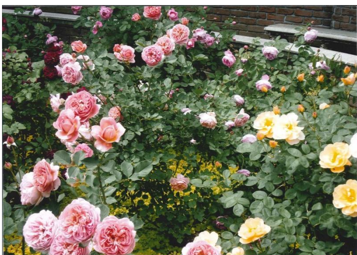
実行委員長特別賞 「ばらだより」

次年度以降も七ツ洞フォトコンテストが継続して実施される予定ですので、四季を通じた七ツ洞の一番美しい、すばらしいと思われる作品を多くの方から応募いただきたいと思いますのでよろしくお願いいたします。