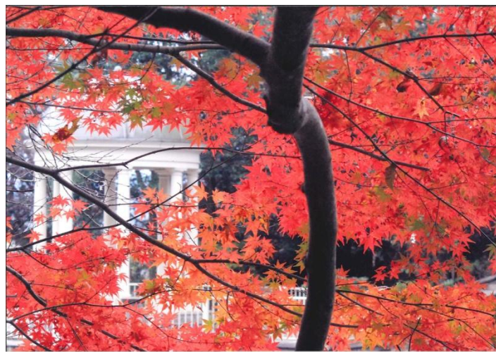
実践会会長賞 「秋容」