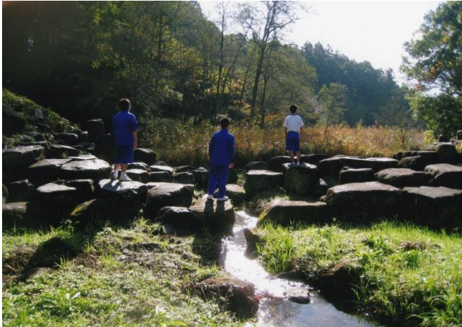
水戸市長賞 「七ツ洞に想う」