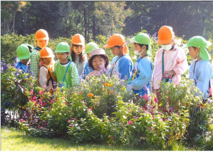
実行委員長特別賞 「この花なんていうのかな？」