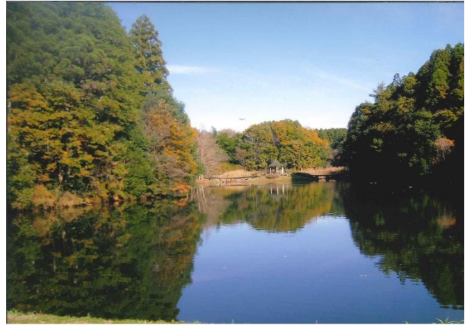
実践会会長賞 「晩秋の七ツ洞」