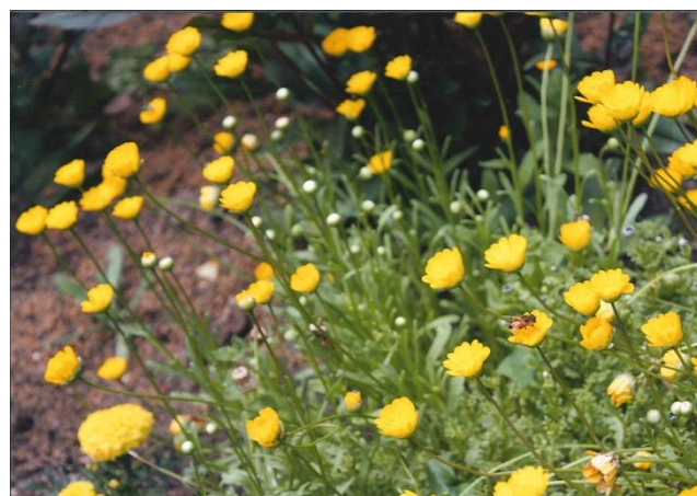
実践会会長賞 「ぶんぶん おさんぽ どこいくの？」