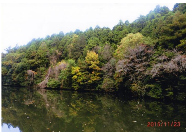
水戸市長賞 「静かなる朝」