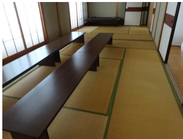
ラウンジ脇の和室です。