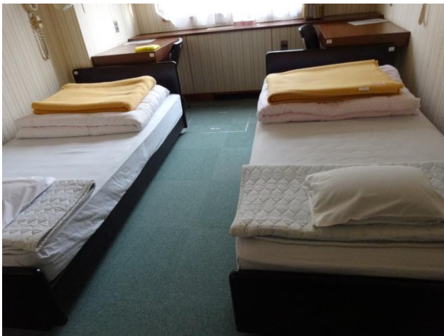
「ツインルーム」です。