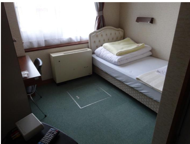
「講師室」です。まるでビジネスホテル並みです。