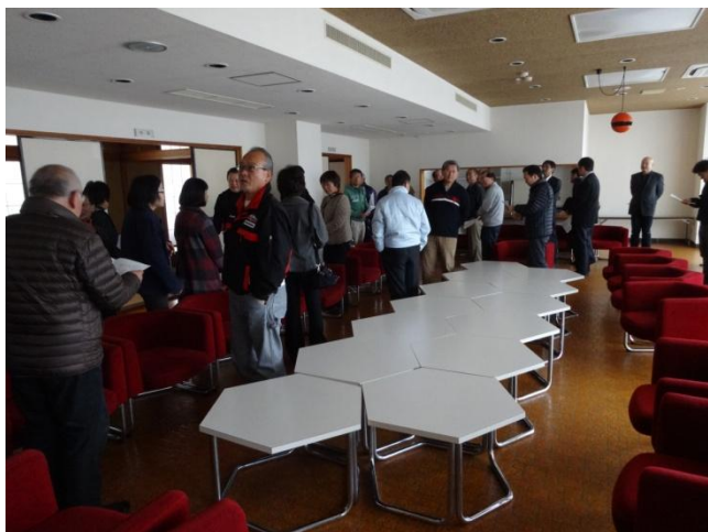
「宿泊棟」のラウンジです。

参加者は、国田地区自治実践会役員並びに各地区の自治会長、各団体の長の皆さん約40名で行われました。