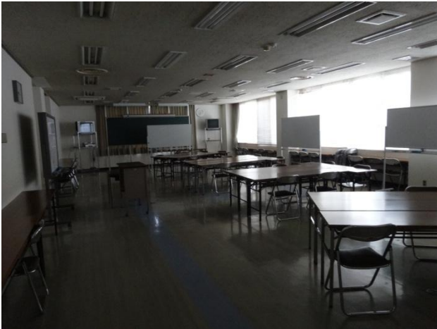
「研修棟」の会議室です。