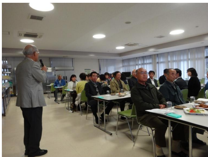
会長あいさつです。