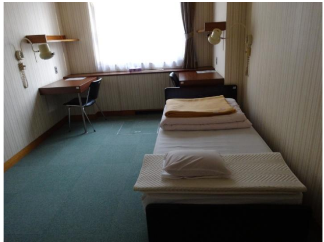
「シングルルーム」です。