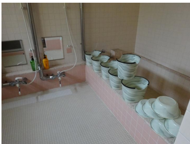
「入浴室」です。男女それぞれ別れています。男女で参加者が多い方が大浴室を使用します。