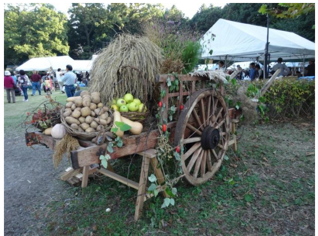
会場入り口のハーベスト・クラシカルアート