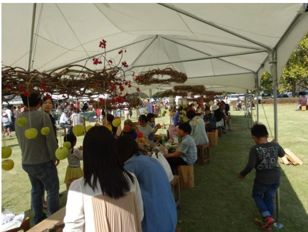
秋の収穫物などでデコレーションしたセンターテーブルで、多くの方が食事や休憩を取っています。