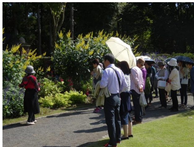
MEG 会員による秘密の花苑の花案内