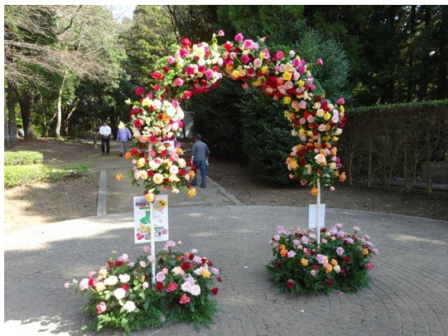
秘密の花苑入り口のバラのアーチ のオブジェクト