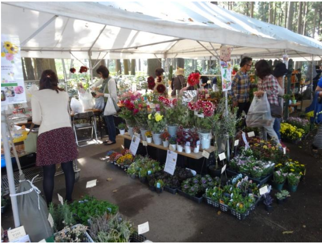
予約によるハンギングバスケット 教室の材料等です。