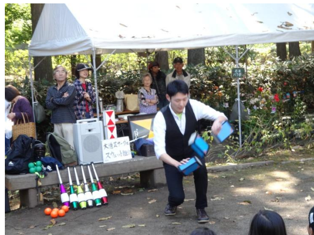
茨城大学大道芸サークルの演技