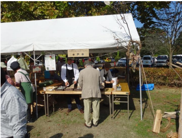
水戸市インフォメーションコーナー