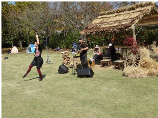
収穫小屋の前でのアイリッシュ音楽 (バグパイプ&ダンス)