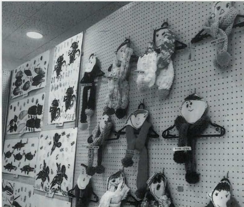
幼稚園児の作品発表(上)