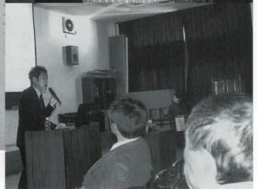
水戸市都市計画部長の講演(右下)