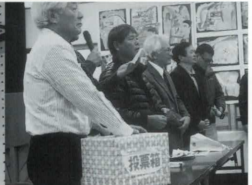
抽選会を楽しむ(右上)